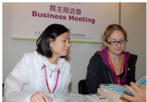
買主商洽會 Business Meeting

TITAS 2010展前首場採購商洽會將在4月份舉辦,目前已確定有美國、義大利、捷克、中國大陸及香港等地區,將近10個國際戶外品牌來台,採購商洽會的規畫及安排,將在這次研討會中正式對外說明。